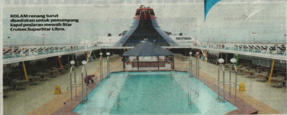
KOLAM renang turut disediakan untuk penumpang kapal pesiar mewah Star Cruises SuperStar Libra.