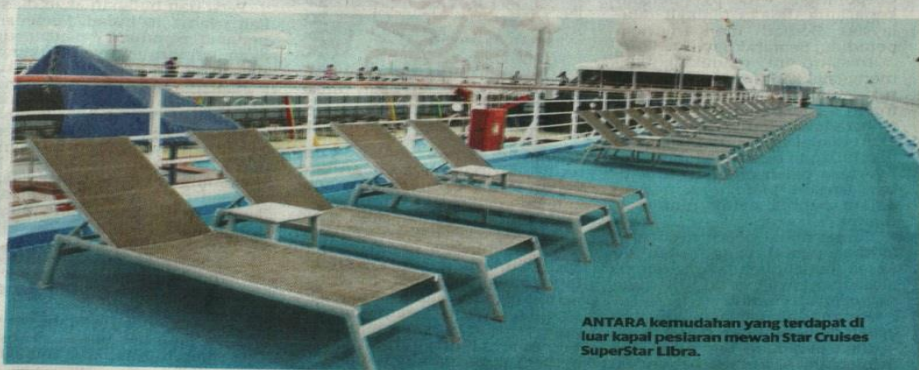
ANTARA kemudahan yang terdapat di luar kapal pesiar mewah Star Cruises SuperStar Libra.