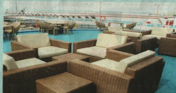
SOFA yang bertilam empuk menjadi salah satu tarikan utama untuk penumpang bersantai.

Turut ditawarkan adalah pakej pelayaran satu malam ke pe-